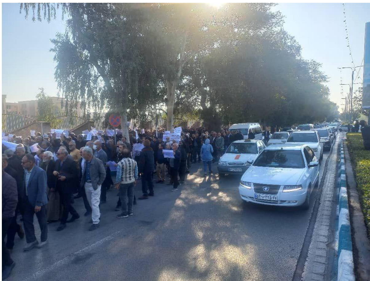
تصویری از تجمع مشترک مقابل استانداری خوزستان