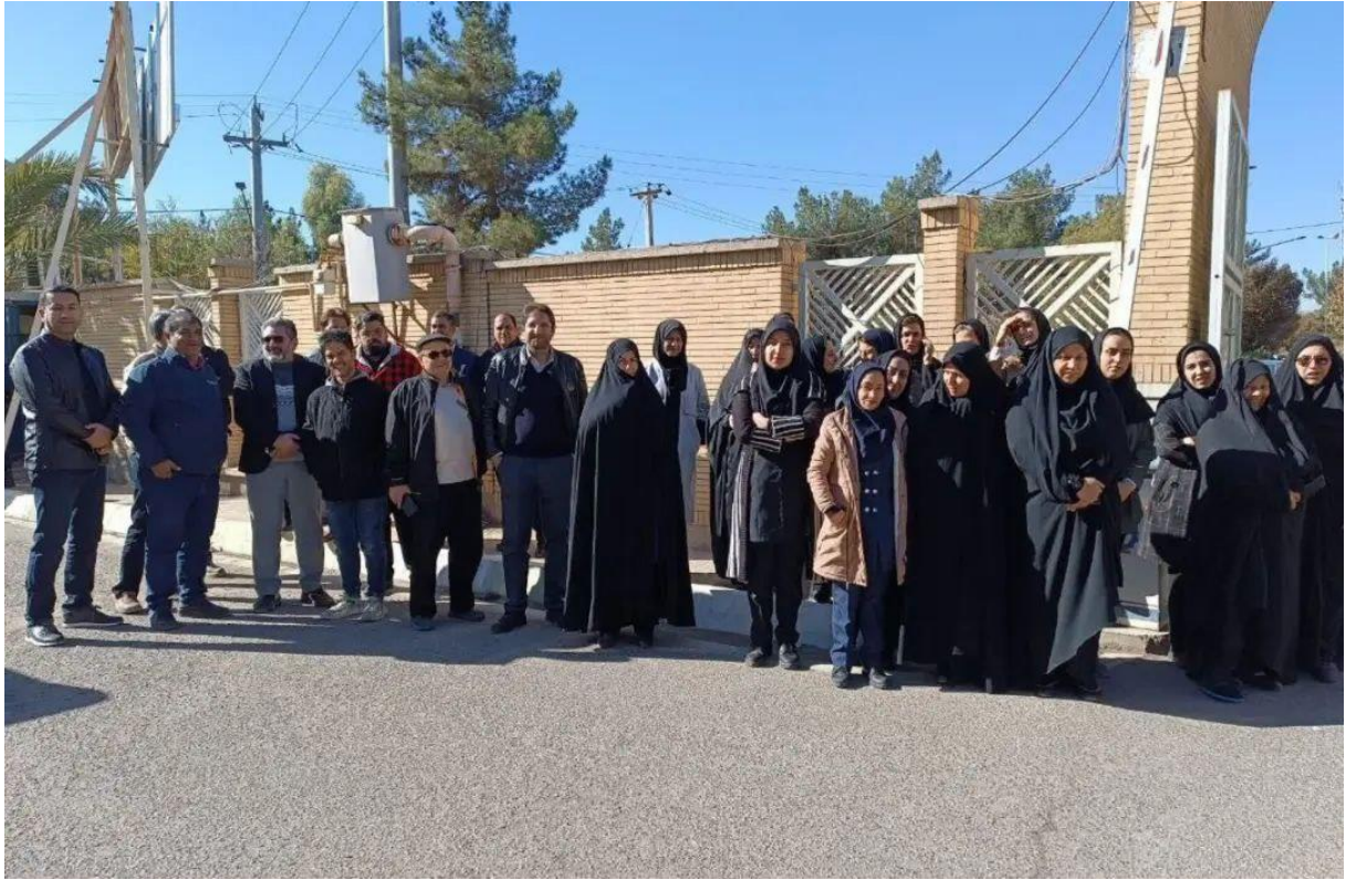
*تجمع اعتراضی خانواده‌های دانش‌آموزان مدارس استثنایی مقابل استانداری خراسان رضوی