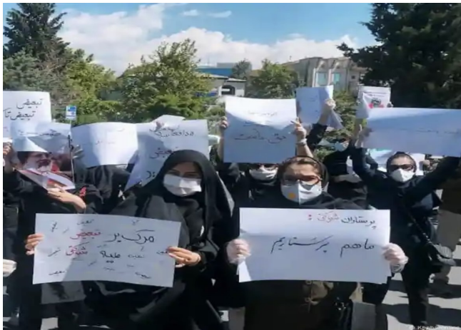
اعتصاب کارگران واگن پارس