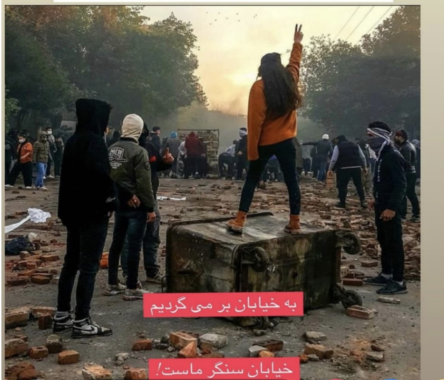
به خیابان بر می‌گردیم