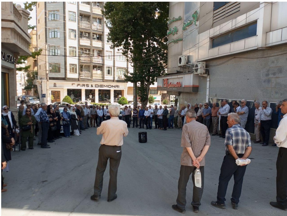
*ادامه اعتراضات کارگران بازنشسته شرکت ملی صنایع مس ایران نسبت به مصوبه انتقال صندوق بازنشستگی مس به زیرمجموعه وزارت رفاه با برپایی تجمع سراسری از جمله در کرمان و سرچشمه رفسنجان