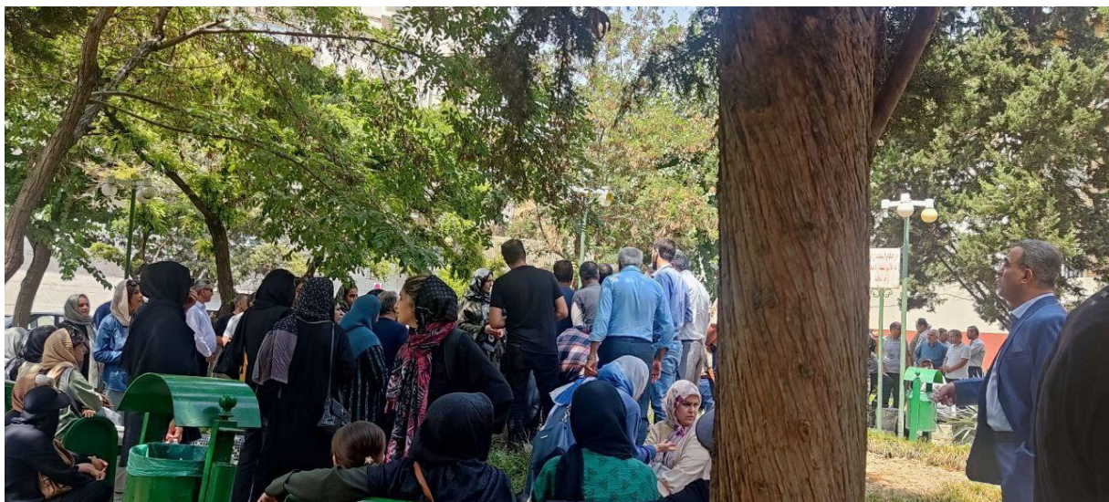
معلم سردشتی جان خود را فدای دانش آموزش کرد

تصویر منتشره درشبکه های اجتماعی بتاريخ 16 مرداد حاکی از تجمع اعتراضی مال باختگان شرکت طراوت نوین ریحان تاک از جمله شرکت های خورویی قزوین وناکستان مقابل نهاد ریاست جمهوری می باشد.