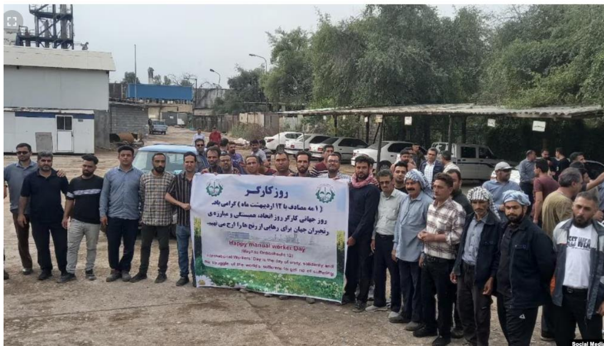
تجمع کارگران شرکت نیشکر هفت‌تپه در روز جهانی کارگر، ۱۴۰۳