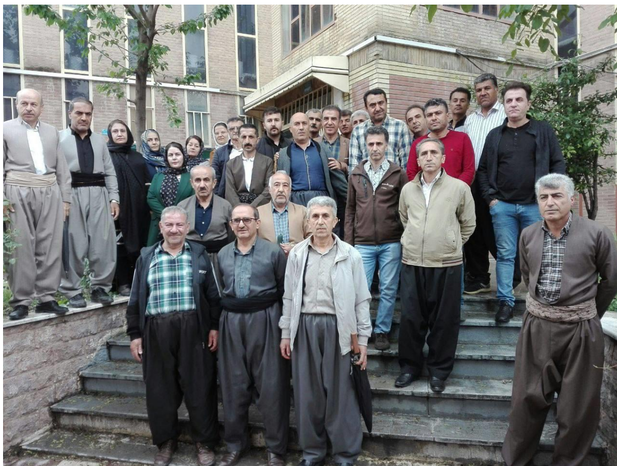
تجمع فرهنگیان شاغل و بازنشسته شهرستان خمینی شهر ، درب اداره آموزش و پرورش