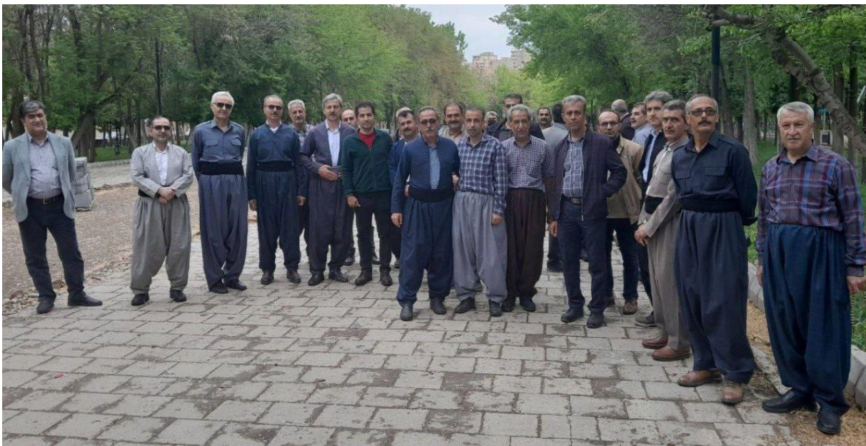
گزارش تجمع شهرستان سقز