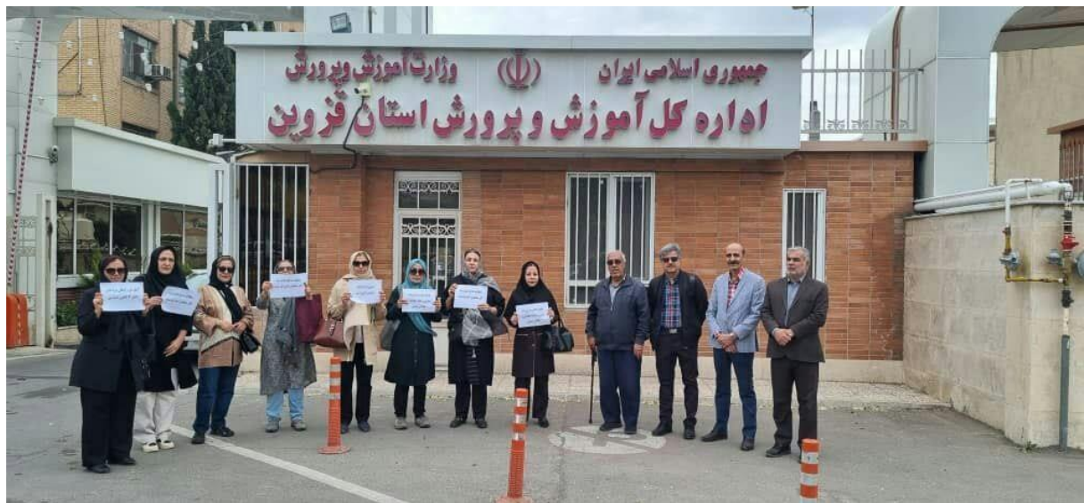
تجمع فرهنگیان مقابل اداره آب گیلان