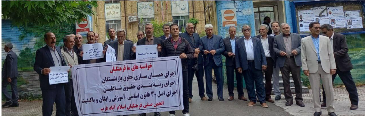
تجمع فرهنگیان شاغل و بازنشسته شهرستان الیگودرز ، درب اداره آموزش و پرورش