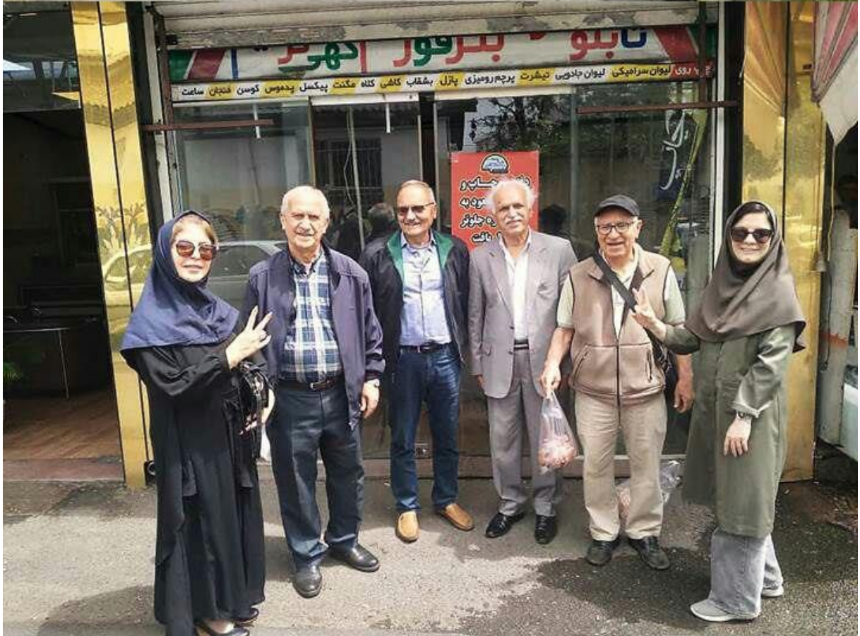
تجمع فرهنگیان مقابل اداره آب یاسوج