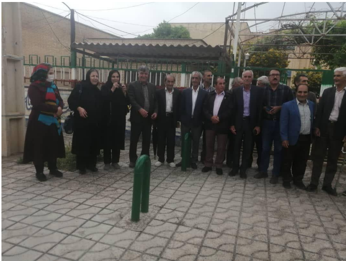
برگزاری تجمع معلمان سنندجی علیرغم تهدید و احضار از سوی نهادهای اطلاعاتی