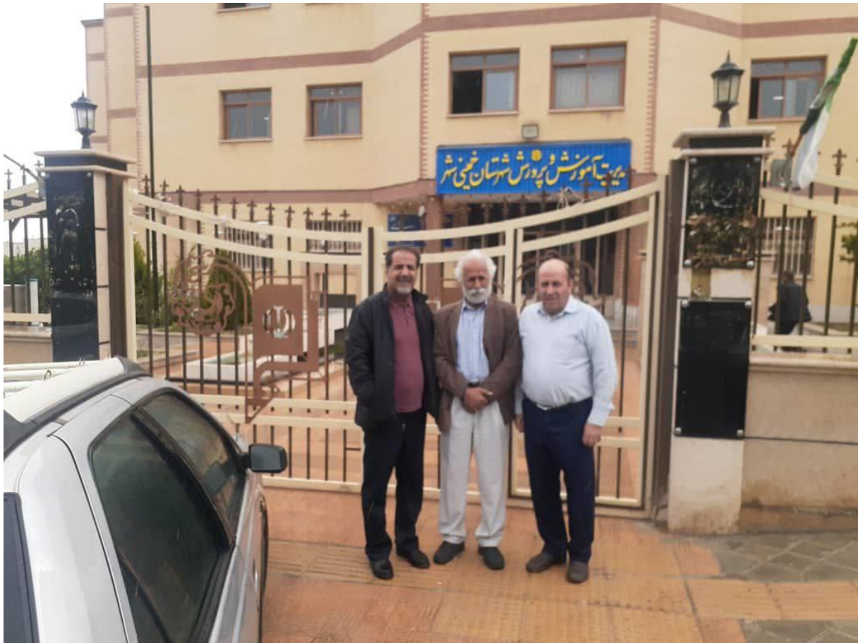
تجمع فرهنگیان مقابل اداره کل آب قزوین