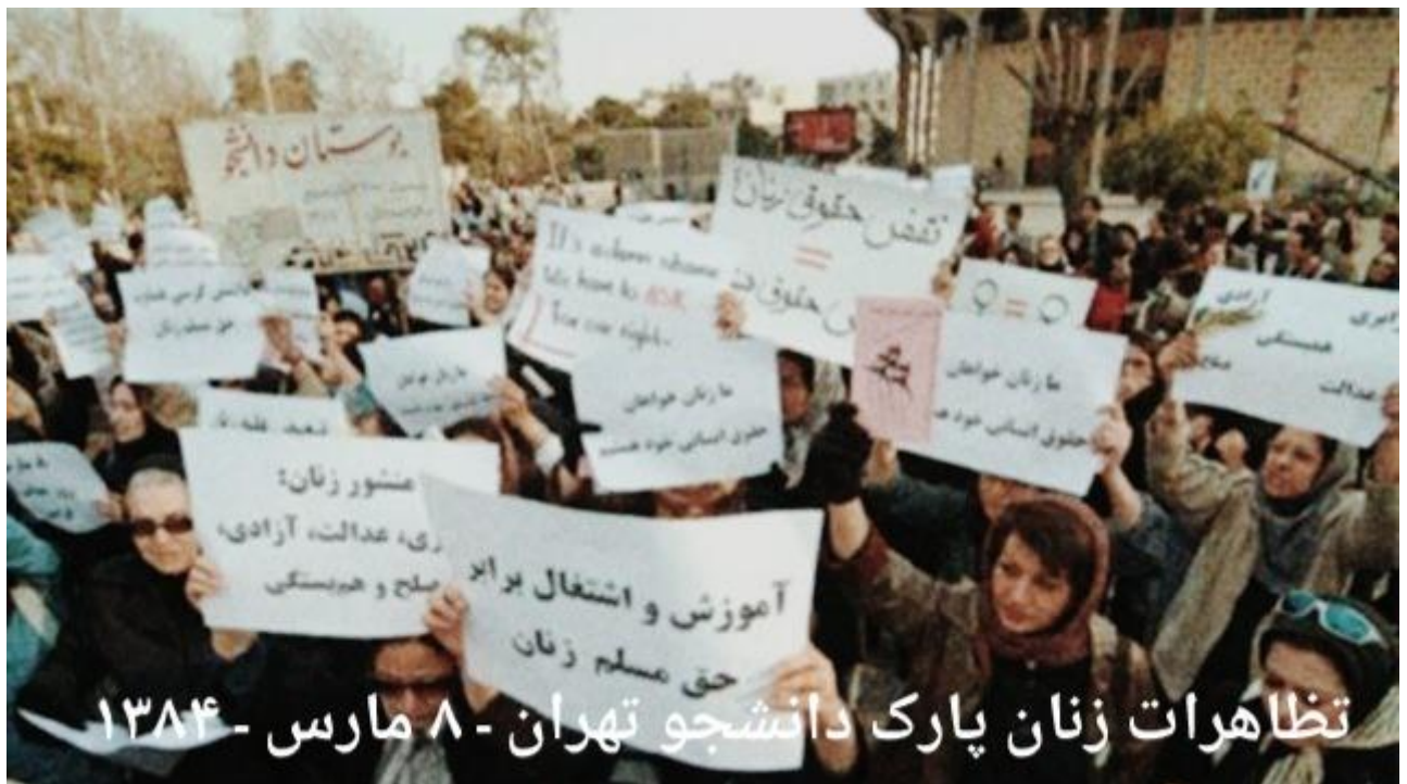
تظاهرات زنان پارک دانشجو تهران - ۸ مارس - ۱۳۸۴

گرفت که در خانه‌های خود دور هم جمع می‌شدند و دربارهٔ مسائل و مشکلات و حقوق پایمال شدهٔ خود با یکدیگر گفت‌وگو می‌کردند. زنان در این جمع‌ها در میان خود برنامه‌های مطالعاتی، نمایش فیلم، سخنرانی و شعرخوانی داشتند. همچنین سالانه مراسم ۸ مارس را در خانه‌های خود برگزار می‌کردند. در میانهٔ دههٔ ۷۰ و پس از سرکوب‌های خونین مخالفان سیاسی و نویسندگان آزادی‌خواه، فضای سیاسی تا حدودی باز شد، البته نه برای مخالفان بلکه برای اصلاح‌طلبان درون حکومت. در چنین فضایی بود که فعالان زنان در نهایت توانستند در اسفند سال ۷۸ برای اولین بار مراسم ۸ مارس را به‌صورت علنی و بیرون از فضای تنگ خانه‌های خود در شهر در چند سال بعد فعالیت. کتاب برگزار کنند. این مراسم با استقبال فراوان زنان روبه‌رو شد. زنان متشکل‌تر و علنی‌تر شد. مراسم ۸ مارس از شهر کتاب و خانهٔ هنرمندان و فرهنگسرا در سال‌های آخر دههٔ ۷۰ شروع شد و در سال‌های ابتدایی دههٔ ۸۰ به خیابان کشیده شد. پارک لاله در سال ۸۲ و پارک دانشجو در سال ۸۴ محل برگزاری مراسم ۸ مارس بود. اما هر دو این مراسم با خشونت نیروهای سرکوبگر و ضرب و شتم شرکت‌کنندگان روبه‌رو شد.